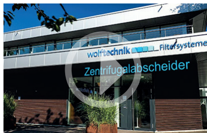
Neue Produktfilme: Beispiel „Zentrifugalabscheider“

New product films: Example “cartridge filters”