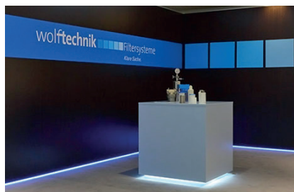
Das Wolftechnik-Movie-Studio The Wolftechnik Movie Studio