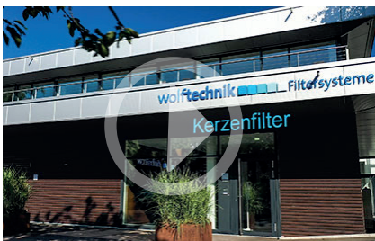
Neue Produktfilme: Beispiel „Kerzenfilter“

During the decisive year 2020 with a practical total failure of all important face-to-face fairs, Wolftechnik also prepared for a return to normality. A new, large exhibition stand was planned and completed. Ideally suited for the presentation of established and new product solutions and innovations. But even in 2021, one fair after the other was canceled and postponed. No trace of planning security - not even in 2022. The new exhibition stand must therefore remain in storage for the time being. This meant that one of the essential components was missing, namely, to visually show the customers product solutions for their filtration tasks and to present them in detail.